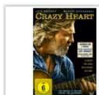
Crazy Heart mit Jeff Bridges, Maggie Gyllenhaal