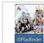
100 Jahre Pfadfinder Ursprung und Entwicklung